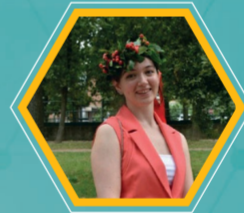
Anna Bay Marketing